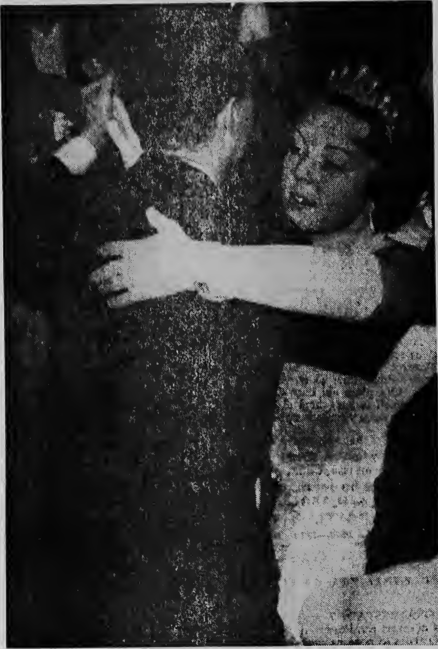
Prinses Beatrix y prinses Margriet ta presente na e afamado baile di opera den capital oriental di Viena. Riba e portret aqui nos ta mira princesa heredera riba dansvloer cu un partner desconoci pa nos.

Minister Soehandrio no kier a duna comentario riba e noticianan for di Den Haag, cu segun cual despues dje del heracionnan di minister di exterior Luns, cu Washington ta existi e posibilidad pa deliberacionnan mutuo, asina nan a anuncia for di Djakarta. Minister Soehandrio a yama e kuestion di Nieuw Guinea, un lucha pa libertad contra e colonialismo.